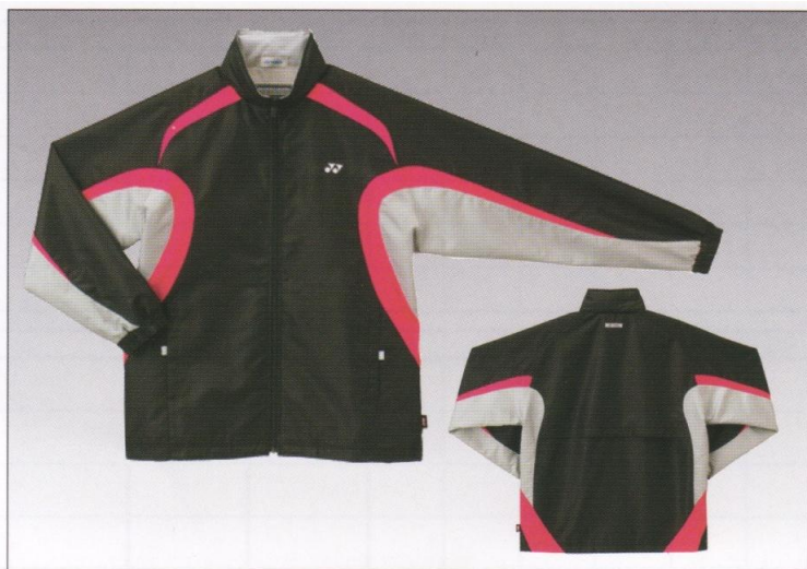
(181) NEW COLOR